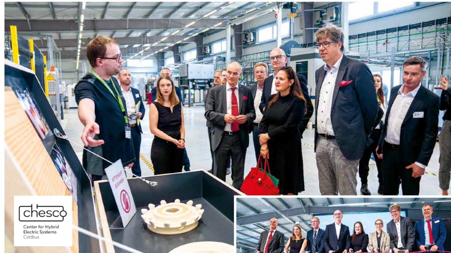
Bei der offiziellen Eröffnung von chesco am 24. Mai bekamen Besucher in den Fertigungshallen einen Blick hinter die Kulissen.