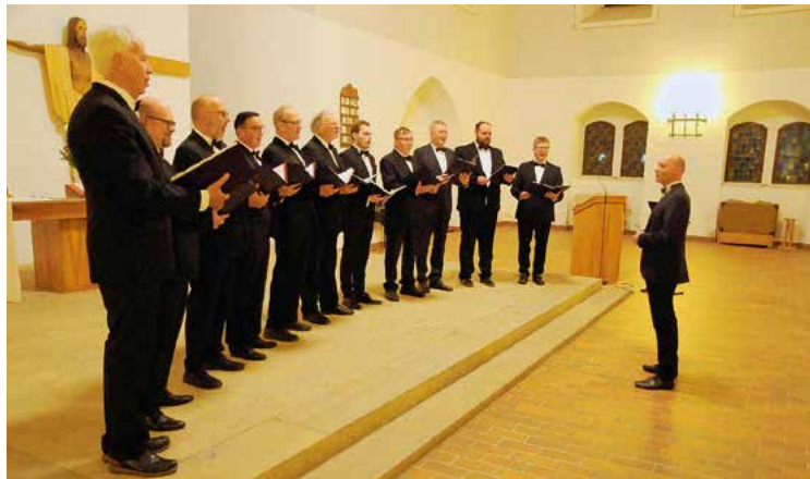
Der Männerchor der Musik- und Kunstschule bei der Probe.

Internationale Weihnacht: Zwei gemeinsame Konzerte der Chöre aus Schwedt zum 1. Adventssonntag, 1. Dezember 2024 um 14 Uhr und um 16:30 Uhr in der beheizten Evangelischen Kirche Sankt Katharinen (Paul-Meyer-Str. 43, Schwedt). Traditionelle und neue Weihnachtslieder aus Deutschland und Polen werden genauso zu hören sein, wie Lieder aus