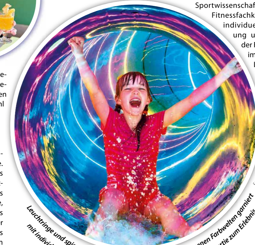
Leuchtringe und spiralförmige Lichtstreifen animiert in den eigenen Farbwellen garniert mit individueller Musik. In der neuen Röhrenrutsche wird die Rutschpartie zum Erlebnis.

Hier fühlen sich vor allem Familien wohl – planschen, rutschen, Spaß haben heißt die Devise. Dafür sorgen Sprudelbecken, Kleinkind-Pools und Strömungskanal. Die neue Erlebnisrutsche mit Licht- und Soundeffekten dürfte das Highlight im Spaßbad werden. Wer möchte, erstellt seine persönliche Rutschpartie bereits vor dem Besuch über den Konfigurator auf der AquariUM-Internetseite. Vor Ort kann dazu das Terminal genutzt oder ein Standardprogramm gewählt werden.