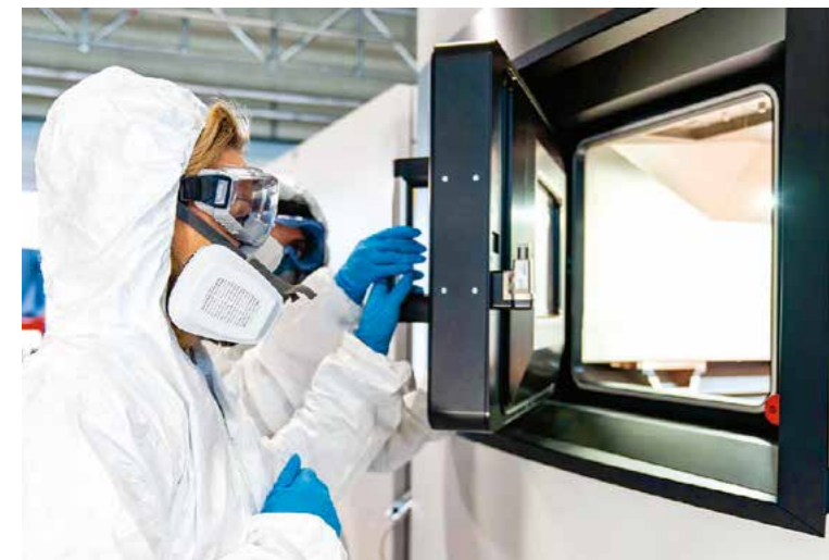
Grundlagen- und Anwendungsforschung sind in der Forschungsfabrik zu Hause.